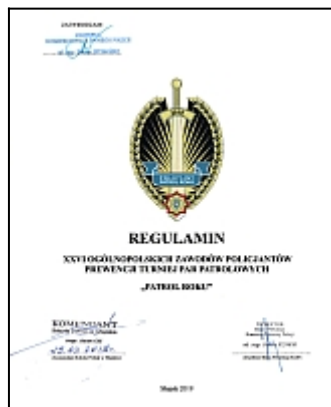
pobierz w pliku .PDF