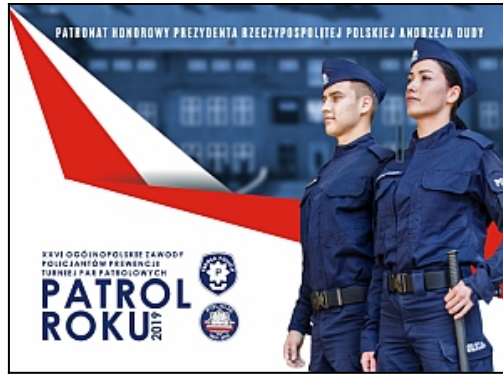
książeczka informacyjna Finału (.pdf 7 MB)