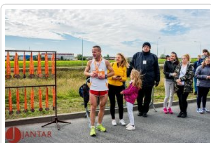
Zwycięzca półmaratonu "Biegiem do Jantara"