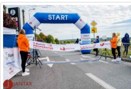
Oczekiwanie na zwycięzcę.