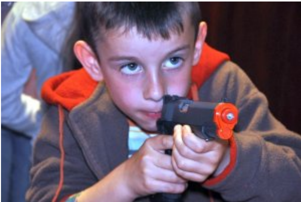
Daktyloskopia, trzeźwość, kajdanki i kaftan bezpieczeństwa.