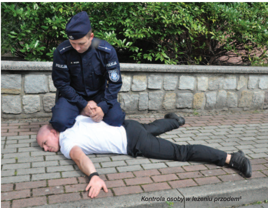
Kontrola osoby w leżeniu przodem 6

Aby wyjaśnić przyczynę śmierci Floyda, należy odnieść się do wiedzy z zakresu medycyny sądowej i anatomii człowieka. Najnowszy podręcznik z medycyny sądowej wskazuje, że: „Duszenie od strony sądowo-lekarskiej można najogólniej zdefiniować jako działanie z zewnątrz organizmu prowadzące w efekcie do niedotlenienia mózgu. Niedotlenienie mózgu trwające wystarczająco długo może doprowadzić do śmierci. Medycyna sądowa zajmuje się uduszeniem gwałtownym, czyli nienaturalnym – w przeciwieństwie do niedotlenienia mózgu z przyczyn naturalnych lub chorobowych, które jest sztywnym momentem każdego umierania” 8 .